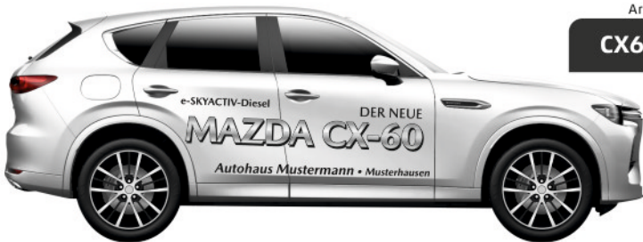
Art. Nr.: CX60D-03