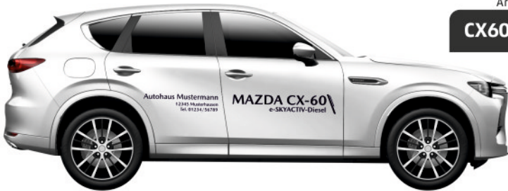
Art. Nr.: CX60D-MINI