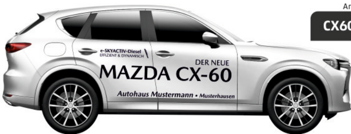
Art. Nr.: CX60D-ECO