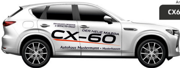
Art. Nr.: CX60D-01