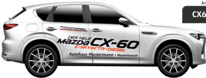
Art. Nr.: CX60D-02